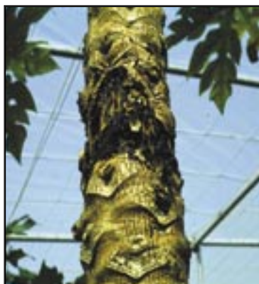
Ataque del taladro.

Cuando el transporte y almacenamiento de la papaya tiene lugar a bajas temperaturas durante un periodo de tiempo largo, se pueden producir daños por frío (Jones, 1942). El daño por frío es una alteración fisiológica que afecta a los productos hortofrutícolas de origen tropical y subtropical cuando éstos se ven expuestos a temperaturas inferiores a una cierta temperatura crítica por debajo de la cual aparecen los síntomas. La tolerancia de la papaya a los daños por frío varía con el cultivar, el grado de madurez y con el tiempo de exposición a dichas temperaturas. Algunos autores (Chen y Paull, 1986) describen la aparición de daños por frío después de 14 días a 7° C para fruta en el quiebre de color y a los 21 días cuando la fruta tiene el 60% de la piel de color amarillo. Este fenómeno puede ser explicado por una disminución en la síntesis de algunos compuestos de impor-