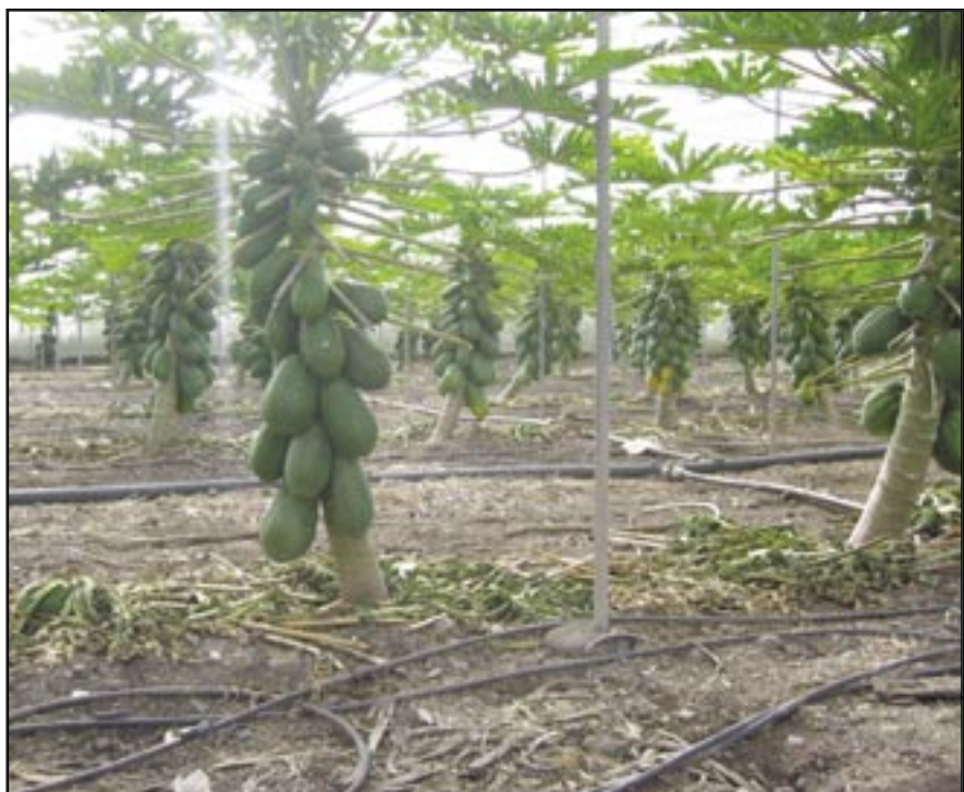
Cultivar del tipo maradol.

Nutrientes esenciales. - Se hace un análisis de los elementos más importantes y de su incidencia.