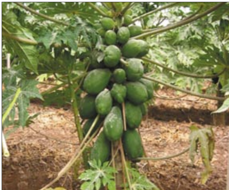
Cultivar de papaya del tipo BH-65.

El Departamento de Fruticultura Tropical del Instituto Canario de Investigaciones Agrarias (ICIA) ha trabajado desde los años setenta en diferentes aspectos de la papaya como biología floral, técnicas de cultivo relacionadas con marcos de plantación, retardantes de crecimiento, cultivo protegido y evaluación de cultivares. De los estudios realizados se concluye que el cultivo de la papaya en Canarias puede adquirir un gran desarrollo si se cuidan de forma rigurosa las pautas exigidas en el mercado de exportación.