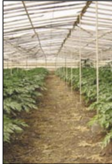
Papaya del tipo BH-65.

con plantas femeninas, masculinas y hermafroditas. Buena productividad. El peso del fruto está entre 1,5 y 2 kilos. (Chan et al., 1994)