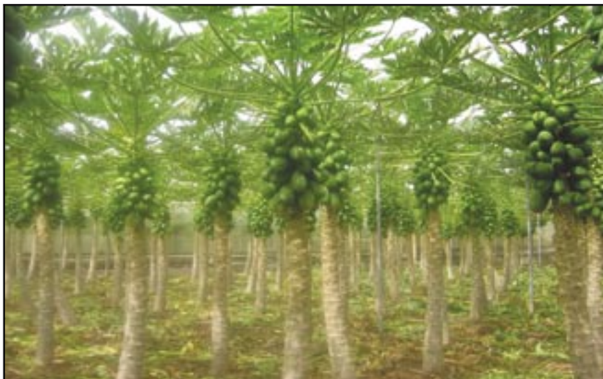
Cultivar del tipo Baixinho de Santa Amalia.

Ventilación del invernadero.- La ventilación del invernadero es necesaria sobre todo en los meses de verano, con el fin de evitar que las temperaturas se eleven demasiado (35° C) y ocasionen tramos en la planta en que predomine la formación de flores estériles por un lado y carpeloides por