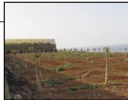
Parcela sana (foto izquierda) y parcela enferma (foto derecha) con el virus PRSV.