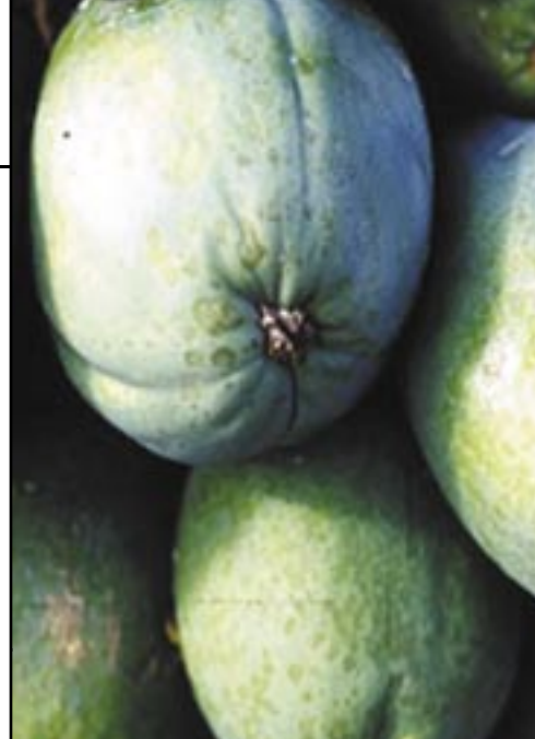
Frutos con síntomas del virus PRSV.

El control de la maduración forzada es, sin duda, uno de los factores que afectan a la calidad final de la papaya. La aplicación de etileno exógeno permite la maduración rápida y