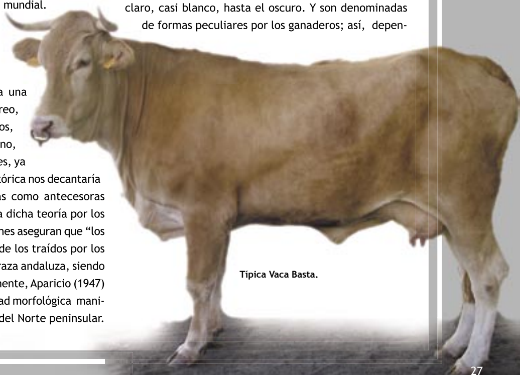
Típica Vaca Basta.

Vaca Basta. - Muy rustica y longeva, de carácter manso, perfil recto o subconvexo, longilínea y eumétrica. De cabeza bien proporcionada, descarnada y más alargada en las hembras, tiene hocico ancho, con pigmentación y orla alrededor del mismo, ojos de perdiz, orejas en disposición horizontal con pelos en su interior que se suelen recortar, cuernos bien desarrollados, cuello corto, fuerte y musculoso. Presenta morrillo en los machos, cruz ligeramente destacada, tórax profundo y alargado, línea dorso lumbar recta, vientre profundo, grupa algo descarnada con hijares bien marcados y poco musculosa, la cola es de inserción alta y gruesa y las extremidades son fuertes. La piel es gruesa y fuerte y el pelo brillante. El color de la capa va desde el rubio claro, casi blanco, hasta el oscuro. Y son denominadas de formas peculiares por los ganaderos; así, depen-