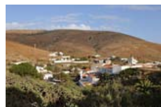
El acuerdo está destinado a revitalizar la capital histórica de Canarias

La primera de las citas fue el pasado viernes en el local The Crescent de la localidad de Salford. Al día siguiente, el grupo grancanario actuó en The Blue Boar de Bolton, para cerrar la gira con un concierto el domingo día 6 en la sala The Gardeners, en Oldham